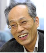
佐高 信氏 評論家、「週刊金 曜日」編集委員