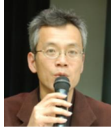
三宅勝久氏 ジャーナリスト