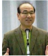
村山士郎氏 教育学者、大東 文化大学教授