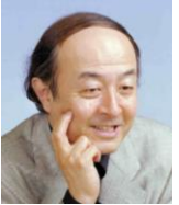
池辺晋一郎氏 作曲家