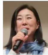
李 政美氏 歌手