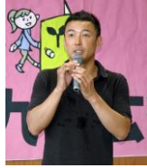
山本太郎氏 参議院議員