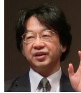
斎藤貴男氏 ジャーナリスト